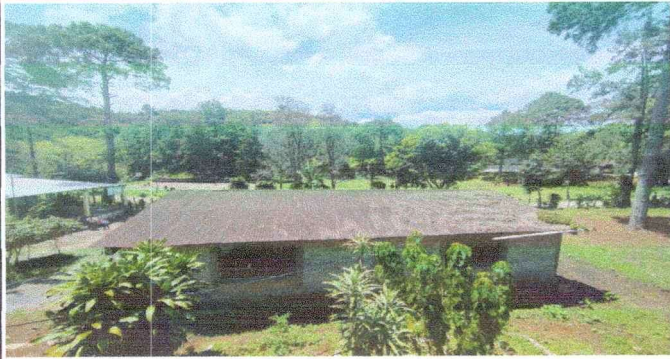
Foto1: Módulo 1: sustitucion de lamina por lamina troquelada